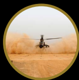
AIRE DE POSER HÉLIOPÈRE MOBILE