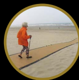
CHEMIN DE PLAGE ENROULABLE PIÉTONS & VÉHICULES