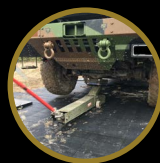
TAPIS DE MAINTENANCE VÉHICULE