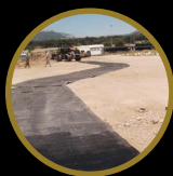
PISTE D'ACCÈS TEMPORAIRE